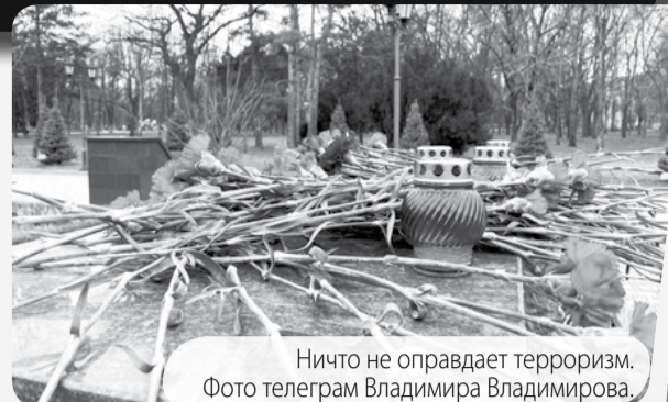
Ничто не оправдывает терроризм.

Вечером в пятницу перед концертом в подмосковном «Крокус Сити Холле» произошёл самый страшный теракт за последние десятилетия в России.