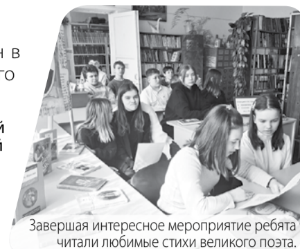
Завершая интересное мероприятие ребята читали любимые стихи великого поэта.