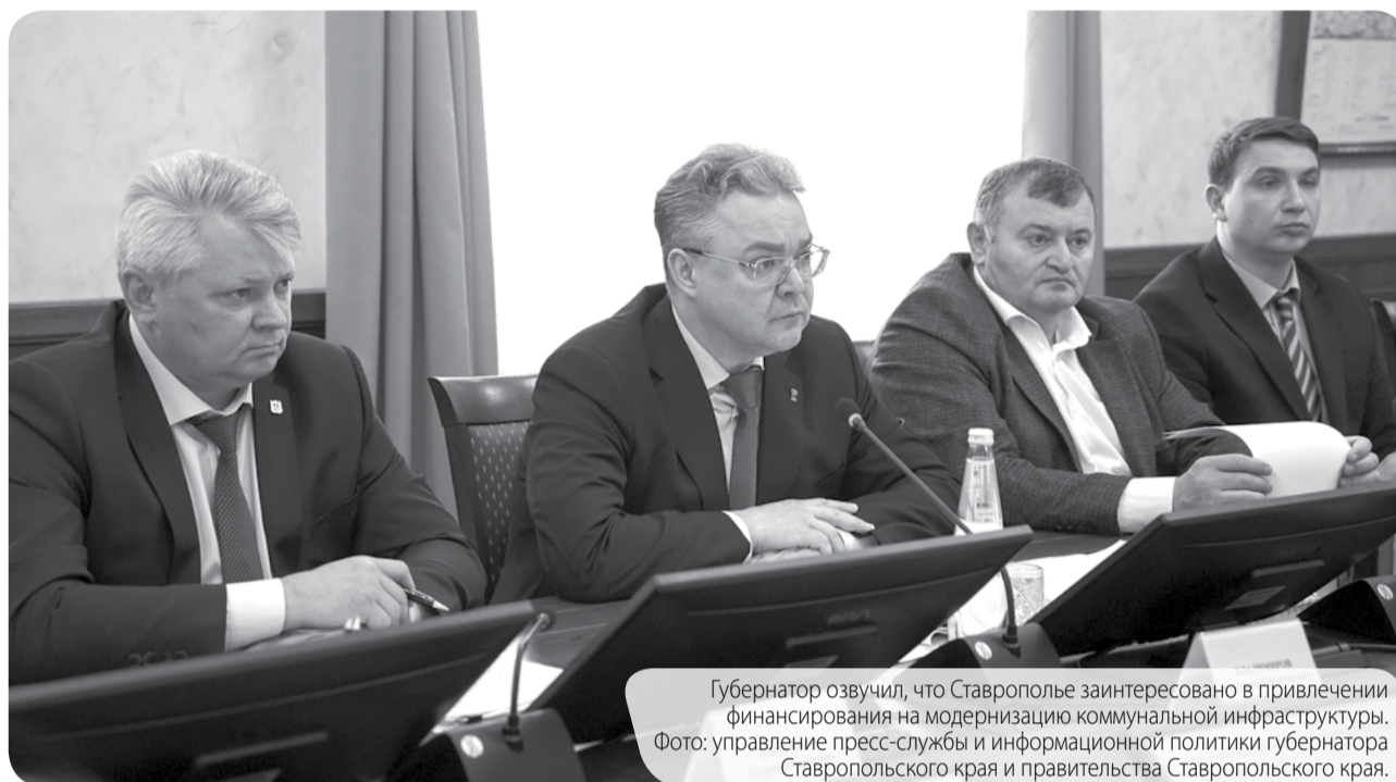
Губернатор озвучил, что Ставрополье заинтересовано в привлечении финансирования на модернизацию коммунальной инфраструктуры.

РОССИЙСКИЕ ИНСТИТУТЫ РАЗВИТИЯ ПОМОГАЮТ В РЕШЕНИИ КЛЮЧЕВЫХ ЗАДАЧ